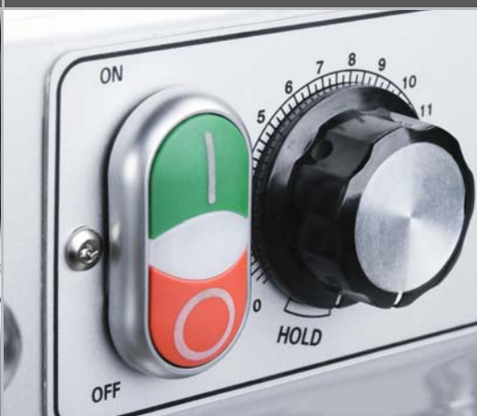
电源控制开关、定时器