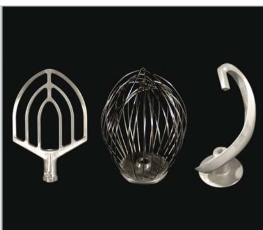
搅拌头：B形搅拌板 D形搅拌球 ED形搅拌钩