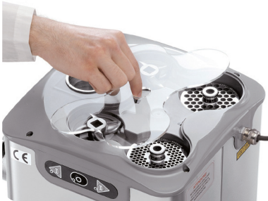
存放刀片和刀盘装置