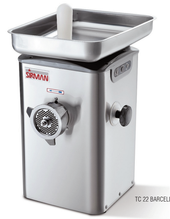
TC 22 BARCELONA