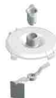
可选件：带刮片的盖子