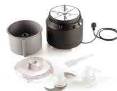
方便拆卸,易于清洁