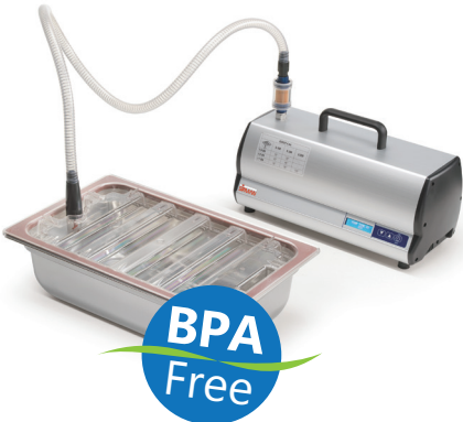
可选件：外接抽真空的导管