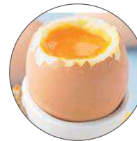
Œuf à la coque / Boiled egg 3 mn