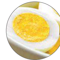
Œuf dur / Hard-boiled egg 10 mn