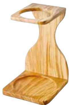
V60 シングルスタンド オリーブウッド VSS-1-OV