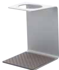
V60 アルミシングルスタンド VSA-1SV

C/T12 021372 幅 120・奥 136・高 168 材質：本体 / アルミニウム トレイ / シリコンゴム