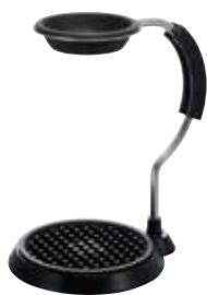
V60 アームスタンド VAS-1

C/T6 021402 幅 120・奥 150・高 220 V60 計量スプーン・VCF-02M40 枚付き 材質：本体 / アルミニウム スタンドリング・トレイ・フタパッキン / シリコンゴム スプーン / ポリプロピレン