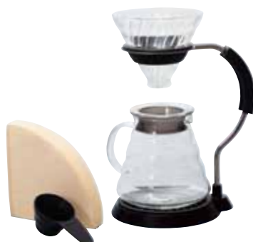
V60 アームスタンドガラスドリッパーセット VAS-8006-G

C/T12 021235 幅 195・奥 140・高 215 材質：本体 / ステンレス・亜鉛合金・ フェノール樹脂 ホルダーリング・ドリフトレイ / シリコンゴム