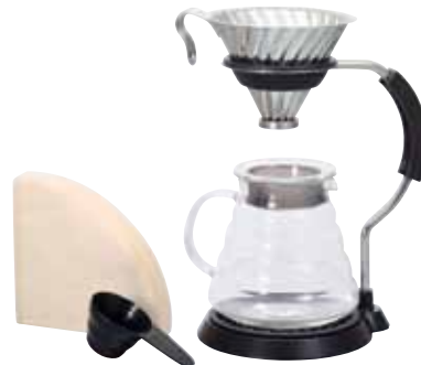
V60 アームスタンドセット VAS-8006-HSV

C/T6 021327 幅 190・奥 155・高 250 V60 計量スプーン・VCF-02M 40 枚付き 材質：ホルダーリング・ドリフトレイ・フタパッキン / シリコンゴム スタンド本体 / ステンレス・亜鉛合金・ フェノール樹脂 スプーン / ポリプロピレン