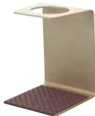
V60 アルミシングルスタンド VSA-1GD