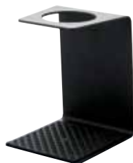
V60 アルミシングルスタンド VSA-1B

C/T12 021372 幅 120・奥 136・高 168 材質：本体 / アルミニウム トレイ / シリコンゴム