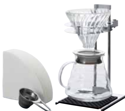
new V60 Pour Over Stand Set VPOS-1506-SV

C/T6 142701 幅 150・奥 150・高 262 V60 計量スプーン・VCF-02W 100 枚付き 材質：フタパッキン・ドリップマット / シリコンゴム スタンド / ステンレス・アルミ・ ネオプレンゴム スプーン / ステンレス