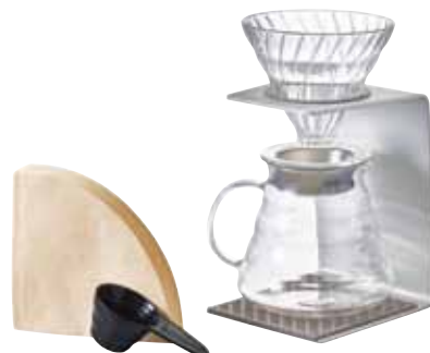
V60 アルミシングルスタンドセット VSA-1006-SV

C/T6 021402 幅 120・奥 150・高 220 V60 計量スプーン・VCF-02M40 枚付き 材質：本体 / アルミニウム スタンドリング・トレイ・フタパッキン / シリコンゴム スプーン / ポリプロピレン