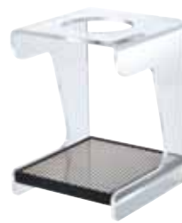
V60 ドリップステーション VSS-1T

C/T12 021228 幅 132・奥 140・高 180 材質：スタンド / アクリル樹脂 トレイ / ABS 樹脂 プレート / ステンレス 2013 年度 iF DESIGN AWARDS 受賞