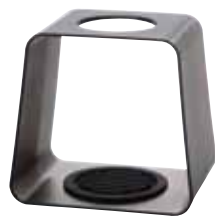
ドリップスタンド キューブ DSC-1TB 021303

C/T12 021297 幅 170・奥 134・高 160 材質：スタンド本体 / メタクリル樹脂 ドリフトレイ / シリコンゴム