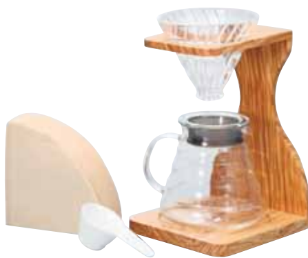
V60 オリーブウッドスタンドセット VSS-1206-OV