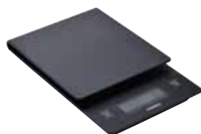
V60 ドリップスケール VST-2000B

C/T20 021211 幅 120・奥 190・高 29 計量範囲 2～2000 g 計測時間 99 分 59 秒 材質：本体 / ABS 樹脂 2013 年度 iF DESIGN AWARDS 受賞