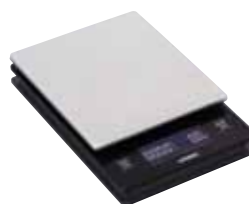
V60 メタルドリップスケール VSTM-2000HSV

C/T20 021211 幅 120・奥 190・高 29 計量範囲 2～2000 g 計測時間 99 分 59 秒 材質：本体 / ABS 樹脂 2013 年度 iF DESIGN AWARDS 受賞