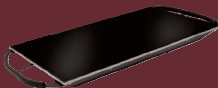
HBG-2418 帶有黑色亞光處理的塑料手柄