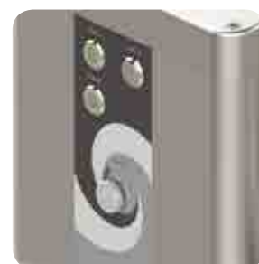
IP 67 保护级控制开关，带点动功能