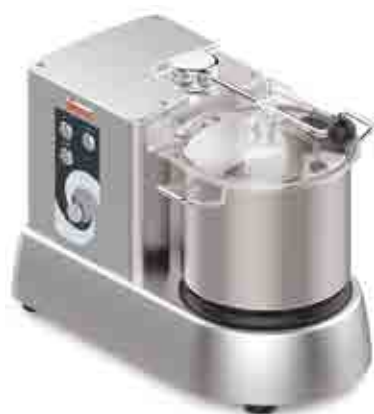
C-TRONIC 6 VT