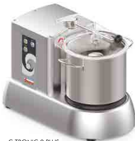
C-TRONIC 9 PLUS