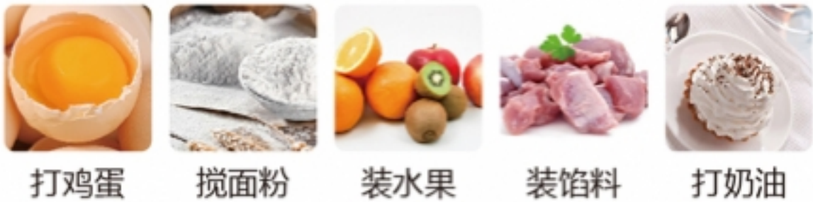
打鸡蛋 搅面粉 装水果 装馅料 打奶油

多功能：可以满足各项料理需求，如：打蛋、馅料、面粉等。 更稳固：采用304不锈钢材质，它的优点是强度高，韧性好，符合食安，并具有良好的耐腐蚀性能的通用钢种。 更省力：底部圆弧设计，打蛋器更加贴合打蛋盆，打发蛋清蛋液更加顺滑，操作更加便捷省力。