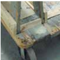
木材- 易碎裂和腐蚀