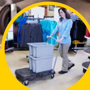
有效地运输大而笨重的 货物。