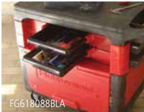
四个分格的零件抽屉