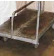
金属- 易凹陷和生锈