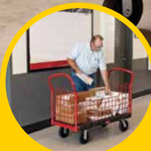
适用于多种环境的通用解决 方案。