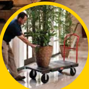
适用于在多种不同环境中 运送重物。