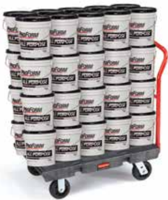
40桶建筑石膏，总重量超过1,088千克 - 完全可以一次负载！

乐柏美特有的Duramold™ 技术大大提高了运载工具强度与重量比的行业标准。我们对产品进行反复测试，以求达到真正坚固耐用的标准，新型物料运送系列产品也不例外。久经考验的耐用性、创新技术以及出色的性能设计让产品能轻松运送重物，使用寿命更长久，让您的工作更轻松。