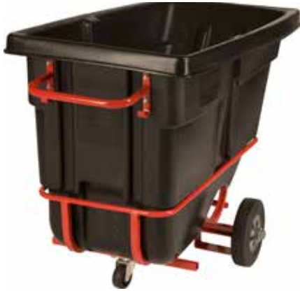
可拖拽牵引式倾卸斗车