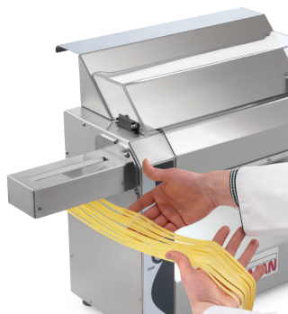
可选件：压面机切刀