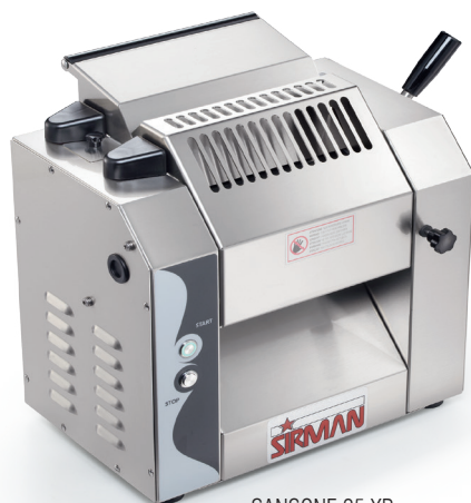
SANSONE 25 XP