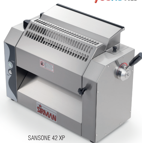
SANSONE 42 XP

紧凑机型 垂直式设计，节省厨房空间，操作更加方便； 安全装置 不锈钢护手罩上面带安全开关，保护操作者安全； 宽细可选 在机器的旁边可以安装切刀，2 mm, 6 mm, 8 mm, 12 mm的切刀可选。