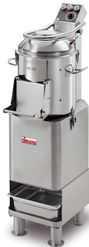
PP/AVJ 10 2V