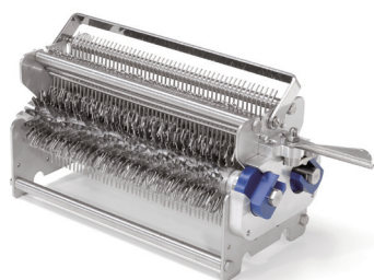
嫩肉机刀组 含 96 个刀片