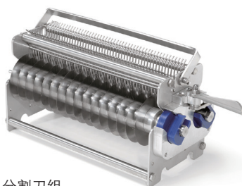
分割刀组 10 mm 厚度，含 48 个刀片 15 mm 厚度，含 32 个刀片