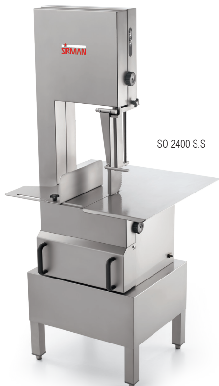
SO 2400 S.S