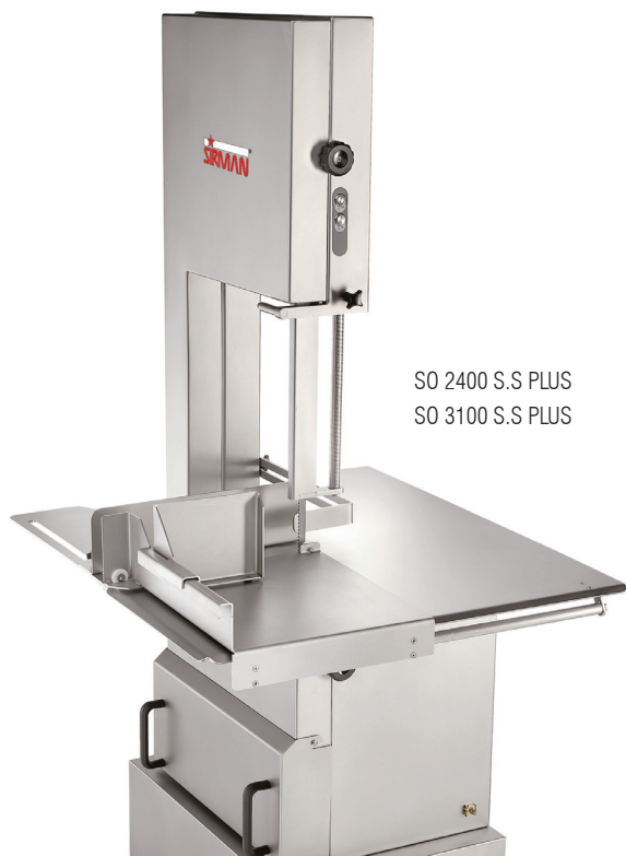
SO 2400 S.S PLUS SO 3100 S.S PLUS