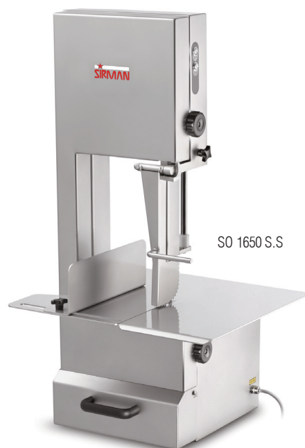
SO 1650 S.S

机器特征 304不锈钢机身，锯条张紧度由系统自动调节；锯条前端带保护罩，确保操作者安全；工作台面带有刻度，锯割更加精准；锯条周边带有白色刮片，可避免油脂浸入锯条和滑轮之间，从而避免在工作过程中锯条掉落的情况。