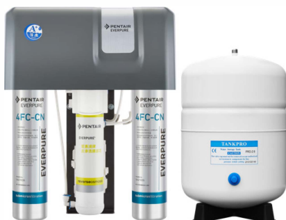
爱惠浦牌RO-200U双出水净水器