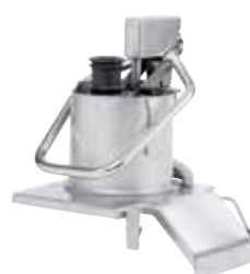
推杆式进料口 带内置管筒 (面积 227 平方厘米) 型号 39673