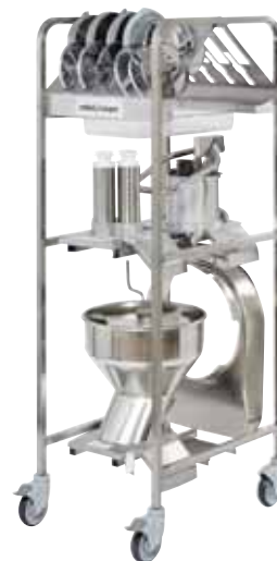
配件放置架, 可存放 16 个刀盘, 8 套配件 及 3 个进料口, 交付 时含一个份数盆 GN 1/1 (不含配件) 型号 49132