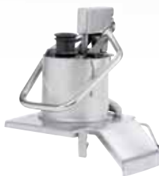
CL 55 推杆式进料口 (面积 227 平方厘米) 带内置管筒