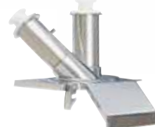
CL 55 2 管筒进料口 直管筒及斜管筒