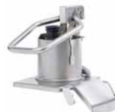
推杆式进料口 型号 39680