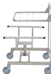
Ergo 移动手推车 交付时不含份数盆 可放置 3 个份数盆 GN 1/1。 型号 49066