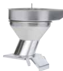
自动进料口 带进料盘 型号 39681