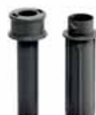
Exactitube推杆 型号 49221