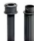
Exactitube推杆 型号 49221