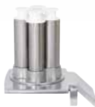
CL 55 4 管筒进料口 2 根管筒 Ø 50 mm / 2 根管筒 Ø 70 mm