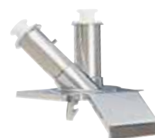
直、斜管筒进料口 型号 28157