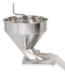
自动进料口 型号 28170