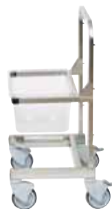
可调节式手推车 3 种 高度 GN 1/1 交付时不含份数盆 型号 49128