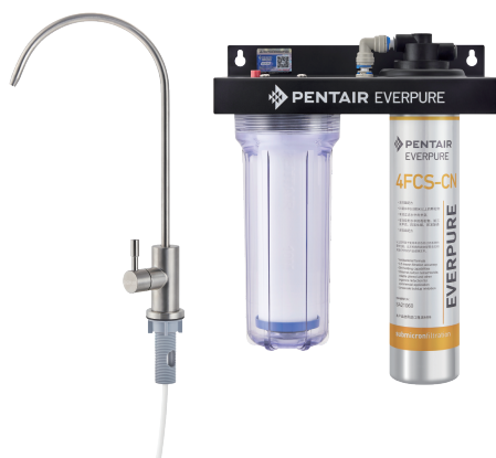
爱惠浦Combo-4FCS-CN型 商用净水器 (系统标配不锈钢水龙头)