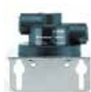
QL1 单滤头 快插