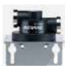
QL1 单滤头 螺纹