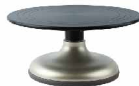
蛋糕转台(硬膜)-金色 铝合金+ABS SN4167 圆径300x135mm