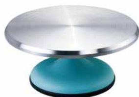
蛋糕转台-粉蓝色 铝合金+ABS SN4171 圆径309x135mm