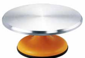
蛋糕转台-粉黄色 铝合金+ABS SN4172 圆径309x135mm