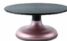
蛋糕转台(硬膜)-玫瑰金色 铝合金+ABS SN4168 圆径300x135mm