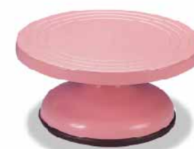
塑料蛋糕转台-粉红色 丙烯腈-丁二烯-苯乙烯树脂(ABS) SN4153 圆径265x127mm