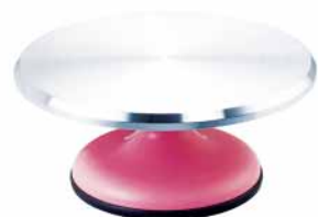
蛋糕转台-粉红色 铝合金+ABS SN4170 圆径309x135mm