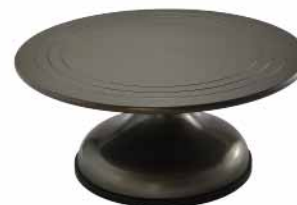
蛋糕转台(硬膜) 铝合金 SN4149 圆径300x135mm