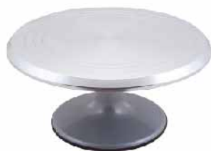
蛋糕转台 铸铝 SN4160 圆径309x140mm