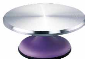
蛋糕转台-粉紫色 铝合金+丙烯腈-丁二烯-苯乙烯树脂(ABS) SN4174 圆径309x135mm