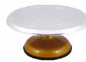
蛋糕转台 铸铝 SN4151 圆径309x140mm