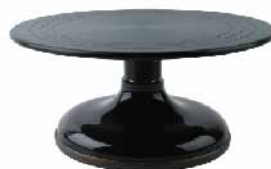
蛋糕转(硬膜)-经典黑色 铝合金+ABS SN4169 圆径300x135mm