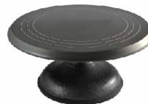
蛋糕转台(硬膜) 铸铝 SN4158 圆径311x141mm