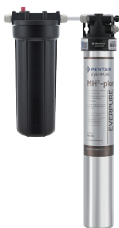
爱惠浦MH 2 -plus套装机 (系统标配不锈钢水龙头)