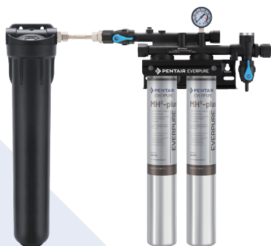
爱惠浦MH 2 -plus双联款 (系统标配不锈钢水龙头)

爱惠浦MH 2 -plus末端净水系统能有效过滤余氯 1 、有机污染物(挥发性酚类)、三氯甲烷、四氯化碳、耗氧量 2 ，在改善口感、确保卫生安全的同时，添加阻垢配方 3 ，减少加热设备的维护成本。