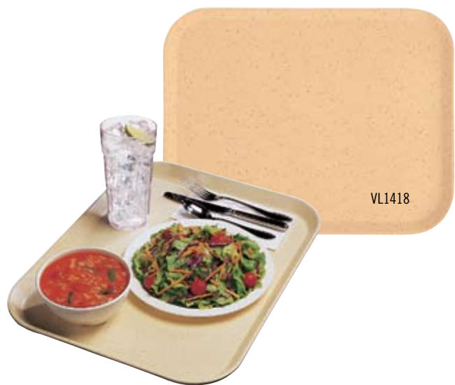
多功能轻质托盘 – 高侧边外形