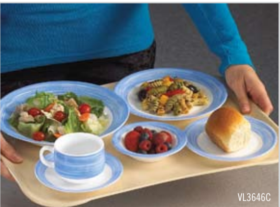
多功能轻质 Century 托盘 – 低侧边设计外形